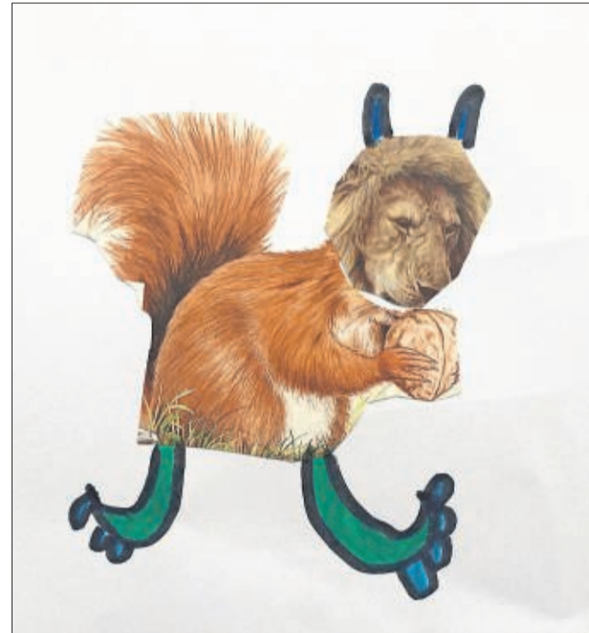
Le Nailion, exemple parmi tant d'autres de ce que peuvent produire l'imagination et la créativité des enfants.

Mais pas si vite: l'élaboration de ce projet unique a nécessité la conjugaison de nombreuses forces. «Pour l'aspect pédagogique, pas de problème