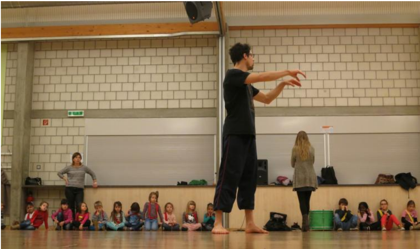
Les enfants apprennent à se glisser dans la peau des animaux qu'ils ont inventés.